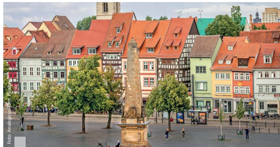
Die Inflation und die stark gestiegenen Bauzinsen haben die Nachfrage nach Immobilien gebremst. In einigen Regionen sinken die Angebotspreise.

Zum ersten Mal nach über zwölf Jahren sanken die Preise für Wohnimmobilien im dritten Quartal 2022 gegenüber dem Vorjahresquartal. Steigende Kreditzinsen sowie der Anstieg der Lebenshaltungs- und der Baukosten führen zu einer nachlassenden Nachfrage nach selbst genutztem Wohneigentum. Dass die Preise dennoch relativ stabil bleiben, liegt an der Knappheit, vermutet das empirica-Institut, denn die Nachfrage infolge von Zu- und Binnenwanderung nimmt weiter zu. Ähnliches berichtet ImmoScout24: Neubau und sanierter Altbau sind von Preissenkungen nahezu nicht betroffen. Der nicht sanierte Gebäudebestand verzeichnet die größten Preisrückgänge. In den Metropolen sinken die Angebotspreise am stärksten, bleiben aber auf einem sehr hohen Niveau. Im ländlichen Raum fallen die Abschläge der Angebotspreise gering aus. Laut immowelt Preiskompass sind die Angebotspreise in 13 von 14 untersuchten Großstädten gesunken – in der Spitze um acht Prozent. Die Kaufnachfrage zog im Januar dank spürbarer Preiskorrekturen wieder leicht an.