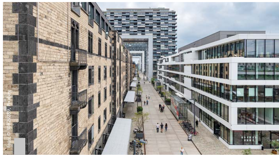
Der deutsche Immobilienmarkt stellt sich heute ganz anders dar als noch vor einem Jahr.

Die Zins- und Preisentwicklung hat in den vergangenen Monaten viele verunsichert. Die Preise für Wohnimmobilien in Deutschland sind im zweiten Quartal 2023 im Vergleich zum Vorjahresquartal um fast zehn Prozent gesunken. Nach Angaben des Statistischen Bundesamtes war dies der stärkste Preisrückgang seit Beginn der Zeitreihe im Jahr 2000. Dennoch ist Wohneigentum in Großstädten um bis zu 64 Prozent teurer als noch vor fünf Jahren. Die gute Nachricht kommt vom IfW Kiel, Institut für Weltwirtschaft: Die Immobilienpreise haben „im zweiten Quartal 2023 die Phase der Preiskorrektur zunächst überwunden und ziehen gegenüber dem Vorquartal wieder an. (...) Die Preise für Eigentumswohnungen gehen zwar zurück, allerdings nur noch leicht und regional sehr unterschiedlich. In einzelnen Städten sind auch steigende Verkaufspreise zu beobachten“. Ein weiteres positives Signal ist die voraussichtlich letzte Leitzinserhöhung Ende September 2023. Mittelfristig werden die Zinsen wieder sinken und die Immobilienfinanzierung erleichtern.